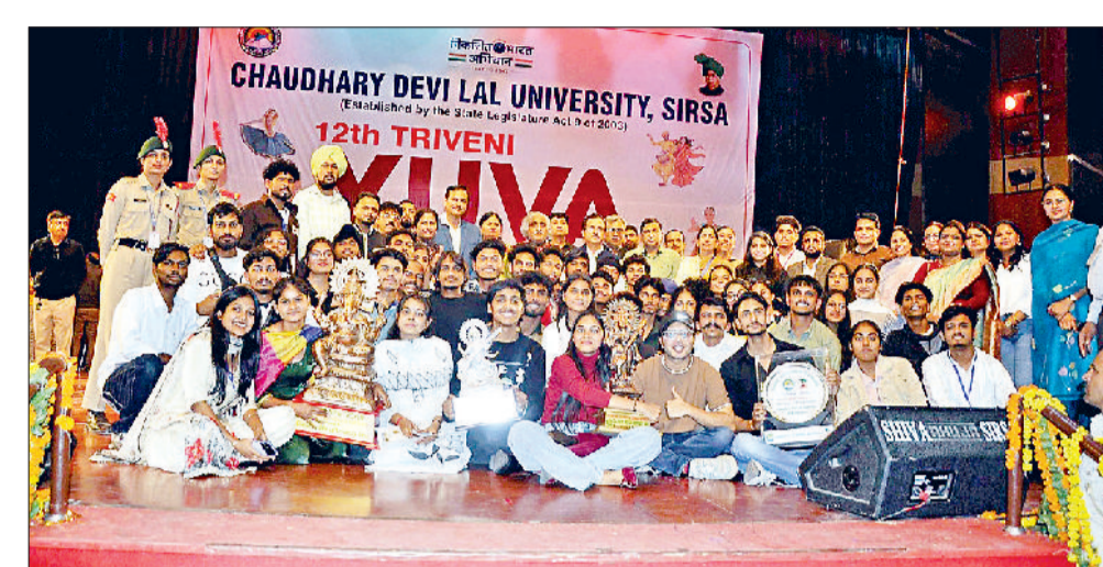
फतेहाबाद। सीडीएल्यू युव फेस्टिवल में ओवरऑल चैंपियन रही एमएम कॉलेज फतेहाबाद की टीम को सम्मानित करते अतिथिगण।