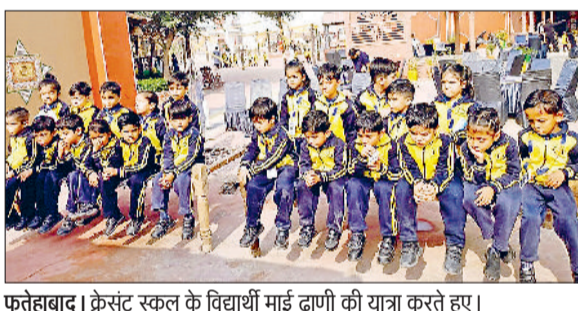
फतेहाबाद। क्रेसंट स्कूल के विद्यार्थी माई ढाणी की यात्रा करते हुए।

■ बाल दिवस के अवसर पर शैक्षणिक भ्रमण किया