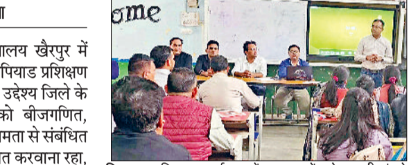
सिरसा। प्रशिक्षण कार्यक्रम में अध्यापकों को तकनीकों से अवगत करावते हुए।