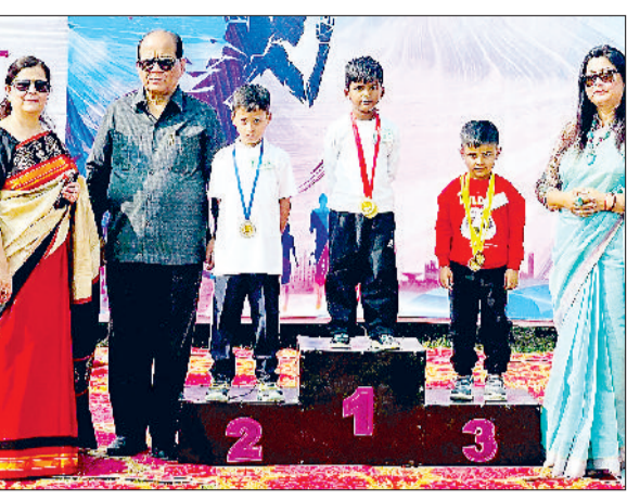
फतेहाबाद। पॉयनियर स्कूल में विजेता बच्चों को सम्मानित करते स्कूल प्रबंधक।