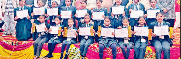
हरिभूमि न्यूज फतेहाबाद।

■ जिला बाल कल्याण परिषद ने किया था आयोजन