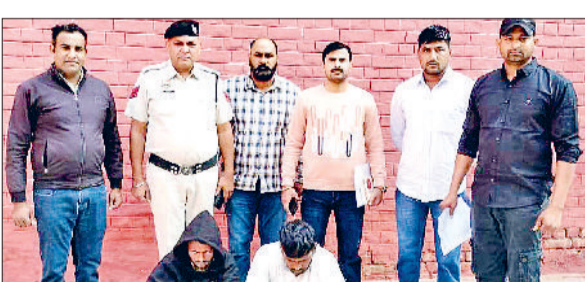
सिरसा। सोना चोरी के आरोपी पुलिस की गिरफ्त में।