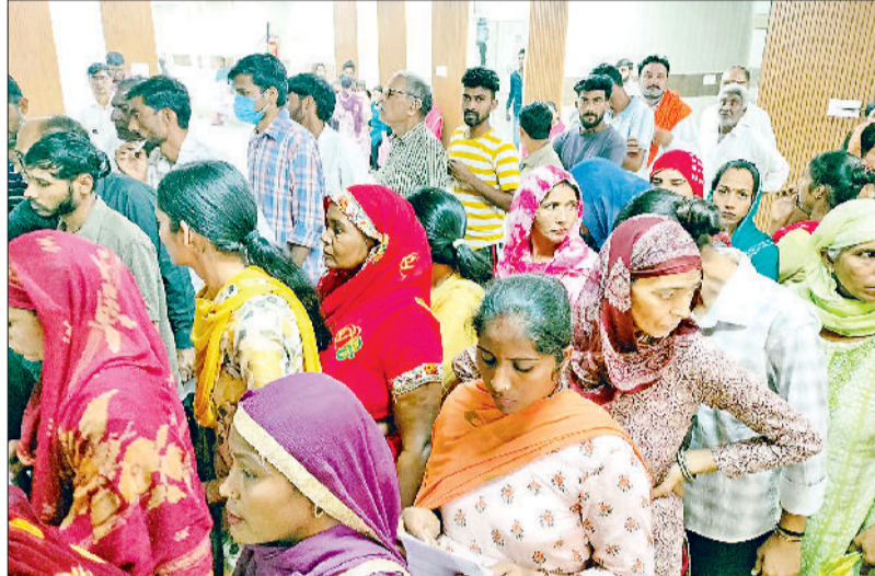
फतेहाबाद। नागरिक अस्पताल में ओपीडी के लिए लगी लाइन।

रात के समय ठंड और दिन के समय गर्मी अधिक पड़ने के कारण लोग बीमार हो रहे हैं। अब तो दिन के समय मच्छर भी अधिक हो गए हैं। दरअसल, घरों में जहां पानी भरा हुआ है वहां पर डेंगू का लारवा मिला रहा है। पंजाब से सटे जिले के जाखल व टोहाना क्षेत्र में डेंगू के ज्यादा मामले सामने आ रहे हैं। अब तक यहाँ 25 लोग डेंगू पॉजिटिव मिल चुके हैं। चिंताजनक बात यह है कि 4 साल बाद जिले में चिकनगुनिया की फिर से एन्ट्री हो गई है। जिले में चिकनगुनिया के 4 मामले सामने आ चुके हैं। डेंगू व चिकनगुनिया के बढ़ते केसों को देखते हुए स्वास्थ्य विभाग अलर्ट हो गया है और टोहाना व जाखल क्षेत्र में सर्वे अभियान शुरू कर दिया है। विभाग की टीम गांवों में जाकर पीड़ितों की स्लाइड बनवा रही है और घर-घर लारवा की जांच कराई जा रही है। पिछले रैपिड फीवर सर्वे में हर माह लगभग 2,000 से 2,500 बुखार पीड़ितों की पहचान हो रही है, और अब तक 2,145 स्थानों पर मच्छर लारवा पाया जा चुका है। जिले में डेंगू पीड़ितों का आंकड़ा