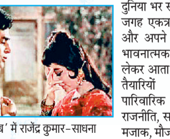
'मेरे महबूब' में राजेंद्र कुमार-साधना

पॉपुलर हुए विदाई के ये गीत शादी के बाद बहूचलन की विदाई का वक्त कुछ ऐसा होता है, जब मिलन और जुदाई, खुशी और आंसू एक साथ एक ही समय व्यक्त हो रहे होते हैं। हिंदी फिल्मों में विदाई के सिचुएशन पर अनेक गीत बने हैं, जो काफी लोकप्रिय हुए। 'छोड़ बाबुल का घर, मोहे पी के वगैर आजा जगना पड़ा' (बाबुल), 'खुशी-खुशी दो दिवा, तुम्हारी बेटी राज करेगी' (अनोखी रात), 'बाबुल की दुआएं लेती जा' (नील कान्हा) आदि करके ऐसे सदाबहार विदाई के गीत हैं, जो आज भी हिंदी पट्टी की शादियों में विदाई के समय खासतौर से बजाए जाते हैं।